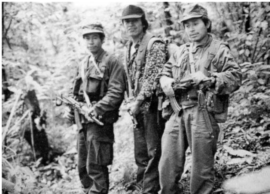
Figura 3. Combatientes Kaqchikel de la ORPA