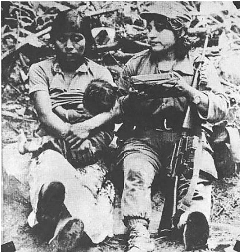
Figura 1. Campamento El Brote, ORPA